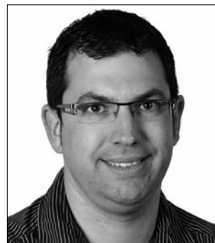
Santi Muní Maureta Hisenda, noves tecnologies, règim intern i governació