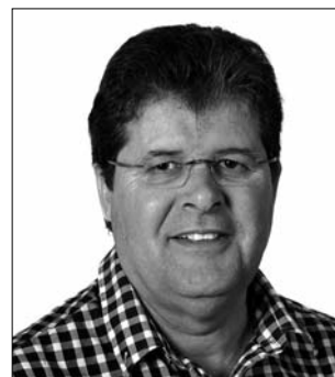
Narcís Oriol Regencós Medi Ambient, recollida d'escombraries, aigua i sanejament