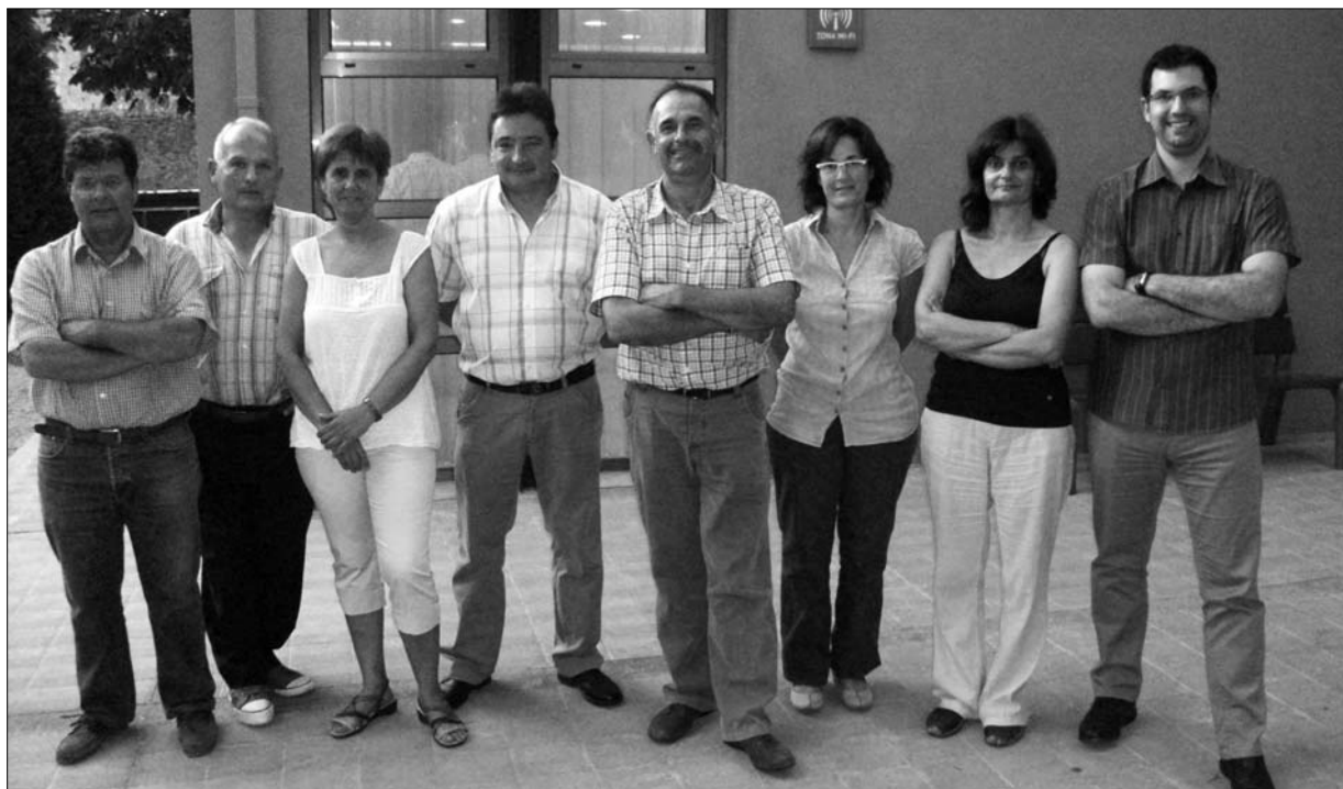
Foto de grup del nou equip de govern.