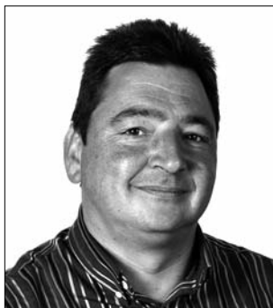
Jaume Teixidor Casas Mobiliari urbà, enllumenat, senyalització viària, Jardins i cementiris